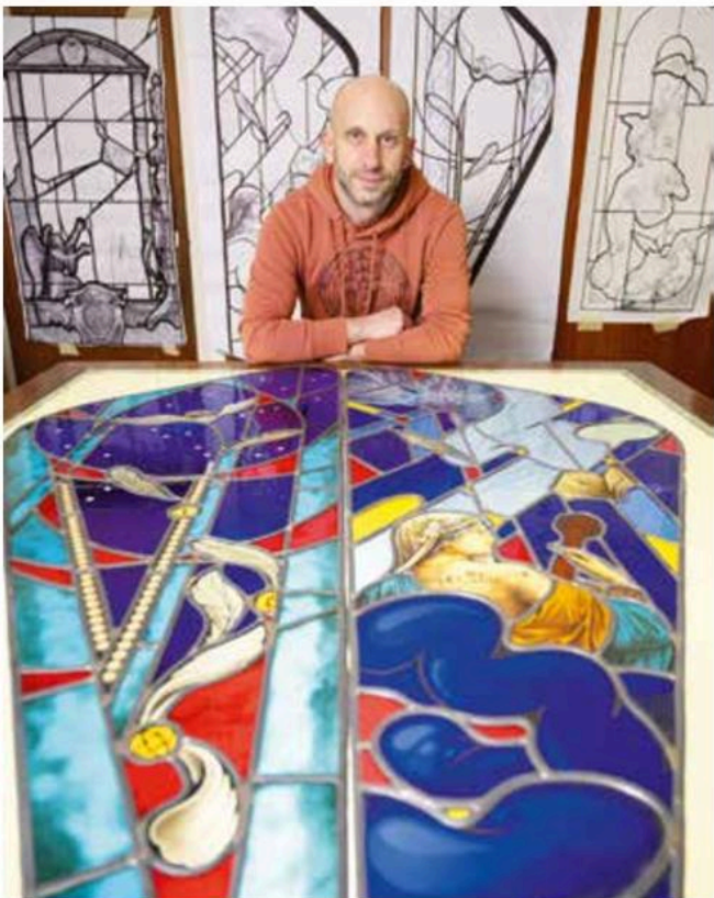
Atelier Vincent Pascal.