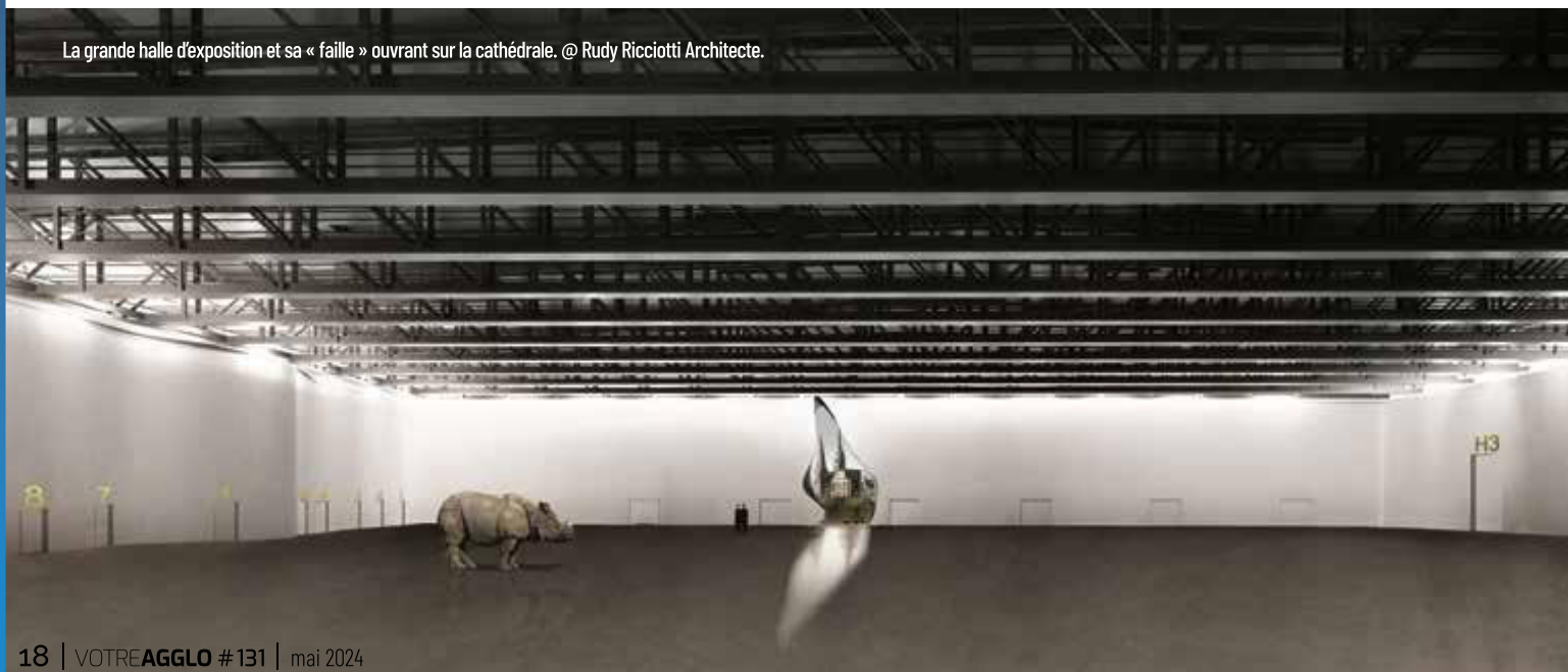
La grande halle d'exposition et sa « faille » ouvrant sur la cathédrale. @ Rudy Ricciotti Architecte.

énormes. Cette femme de grand talent, aujourd'hui malheureusement disparue, a connu des mésaventures du même ordre à Tokyo et ailleurs. Devant l'explosion annoncée des coûts nous avons mis fin au projet. Cela arrive, car contrairement à ce que prétendent certains de mes adversaires, je ne suis ni Ramsès, ni Achille... Ni Brad Pitt (rires).