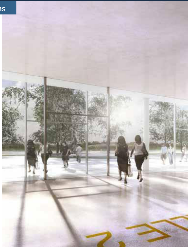
Le hall d'entrée.

Pour le parc expo, c'est le cabinet de madame Zaha Hadid qui a remporté le concours. Elle était mondialement célèbre et le dessin de son projet nous a tous enchantés, même si déjà la difficulté de sa réalisation technique en interrogeait quelques-uns. Là où les choses se sont gâtées rapidement, c'est que le prix annoncé a vite affiché des augmentations